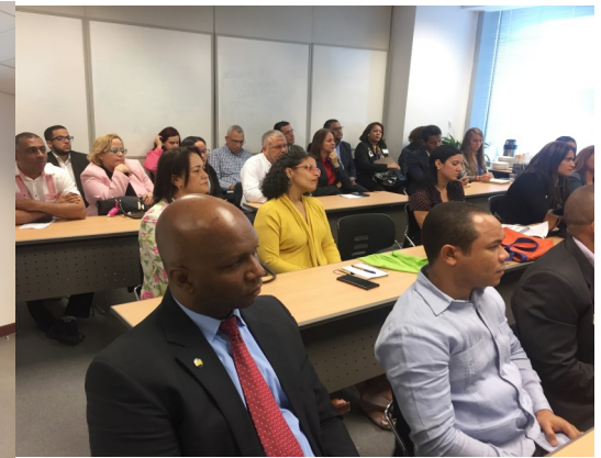
Participantes en el Conversatorio Premios Microempresariales Citi

En apoyo a los objetivos del proyecto Premios Microempresariales Citi y con la participación de 14 entidades microfinancieras del país fue celebrado el jueves 25 de enero el conversatorio “Cómo generar nominaciones exitosas para alcanzar un mayor número de clientes ganadores”.